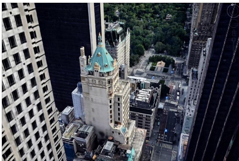
The Crown Building (New York)

Egy másik pletyka Matolcsy Ádámmal kapcsolatban tavaly év végén jelent meg.