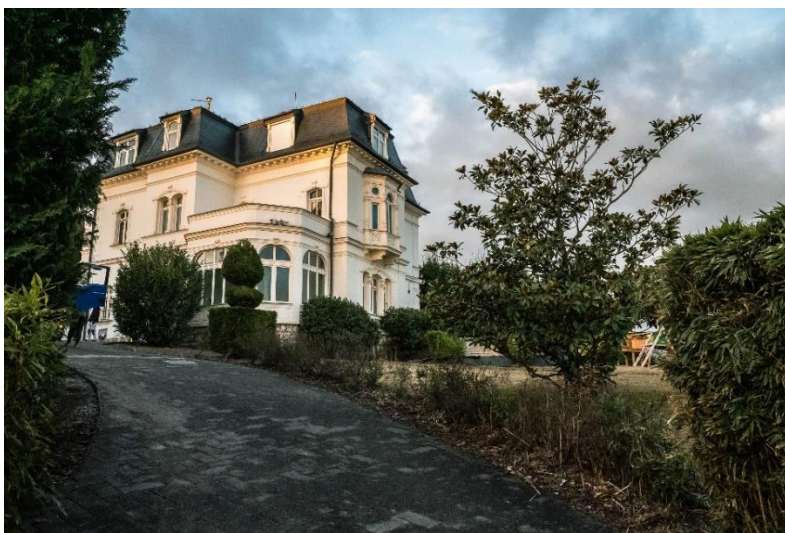
Svábhegyi palota (többé már nem közvagyon)

Amióta Matolcsy átvette a Nemzeti Bank elnöki tisztségét, pénzügyi oktatás és képzés, valamint globális regionális tanulmányok álcája alatt egy sor "közhasznú" alapítványt hozott létre, a bank vagyonának egy részét elvonva, és beosztottjait helyezve az alapítványok vezetésébe.