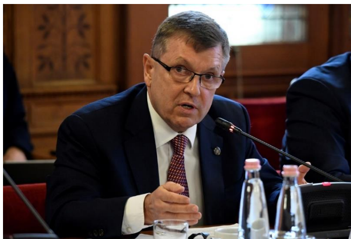
Matolcsy György Országgyűlés gazdasági bizottságban

magyarázatától, miszerint "az Oroszország elleni uniós szankciók okozzák az inflációt". A kormány által bevezetett, több árucikk árának befagyasztására (E95-ös benzinár, cukor, növényi olaj stb.) és a kamatemelések korlátozására irányuló intézkedéseket is elhibázott politikaként bírálta, mert ezek a nemzetgazdaságot sebezhetőbbé és kevésbé ár-érzékenyvé teszik. Matolcsy kihangsúlyozta, hogy ezeket az intézkedéseket nem a Nemzeti Bank kezdeményezte. Azt is tisztázta, hogy a Nemzeti Bank több alkalommal is figyelmeztette a kormányt, hogy a gazdaságpolitikája helytelen.