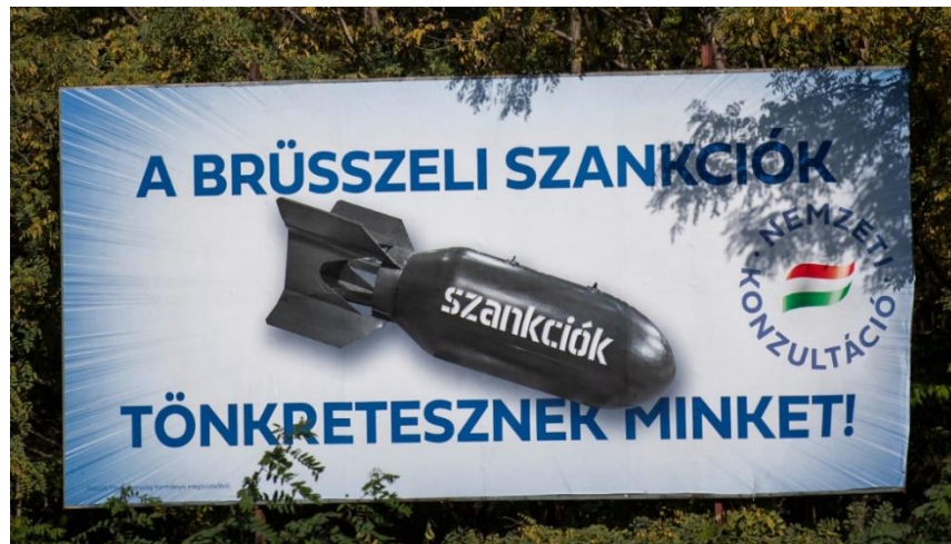
「国民コンサルテーション」キャンペーンの巨大ポスター (標語は「ブリュッセルの制裁がわれわれを破壊する」)

事あるごとに「国民コンサルテーション」を連発する政府に多くの有権者は食傷気味で、とくに若い層や都市住民の間でその傾向がみられる。Fidesz 政権を支持する層でも、ロシアの侵略批判を回避して、制裁反対だけを叫ぶのはあまりに不道徳で恥ずかしいと考える人が多いと思われる。事実、質問用紙と返送用封筒が送られてから1か月経た時点での回答数＝「投票数」は35万人弱であった。これまでの「国民コンサルテーション」の一般傾向（野党は回答を拒否あるいは無視）では、回答数の95%が政府支持