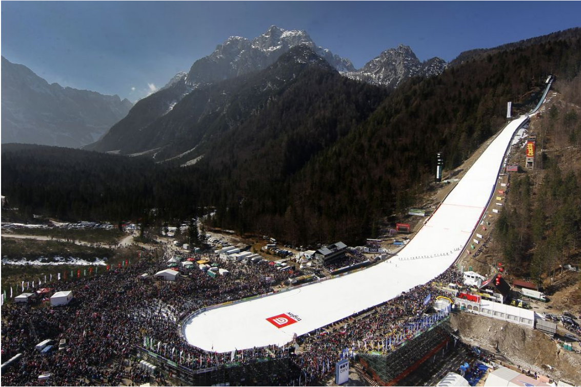
プラニツァ・フライングジャンプ台

Eurosport チャンネルを通して放映されている。欧州に拠点をもつ日本企業が、もっと冬のスポーツのスポンサーになったらどうか。