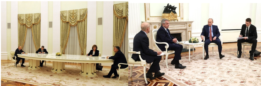
プーチン-オルバン会談

一つは会談における両首脳の間隔である。オルバン首相とは長いテーブルの両端で会談が行われたが、打って変わって翌日のアルゼンチン大統領とは密な会談となった。マクロン大統領とは、オルバン首相と同じく、長いテーブルが使われた。明らかに、ロシア側は相手に応じて、会談の形式を変えていると思われる。